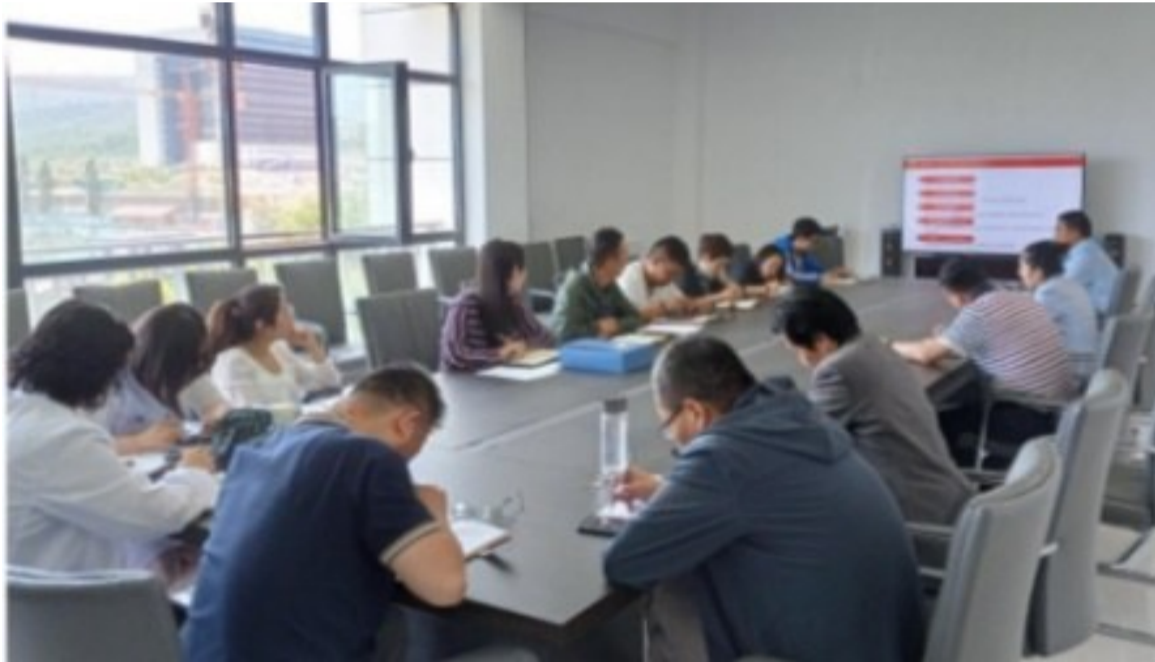
为认真贯彻落实习近平总书记关于加强民法典宣传的重要讲话精神,切实加强《民法典》的学习宣传教育,7月22日学生处团委党支部在学生处3楼会议室开展专题学习会议,组织党员深入学习《中华人民共和国